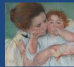
Mary Cassatt (1844 - 1926)

Objectif: Evaluer si un modèle d'attachement insécuré vis-à-vis du conjoint augmente le risque de dépression périnatale, en limitant les capacités de régulation émotionnelle des mères.